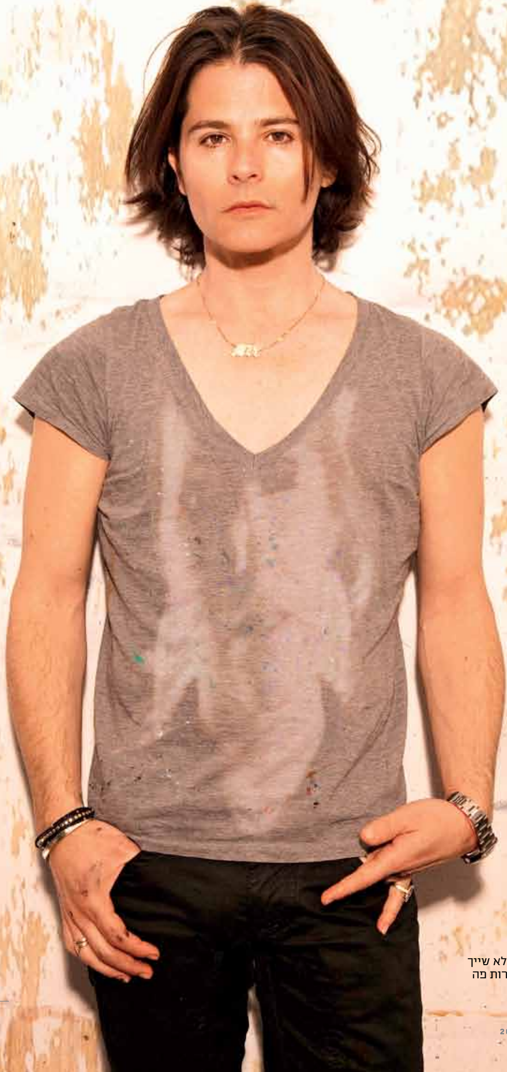
הפקה וסגנון: רועי פייר ועל פאר, ניו יורק