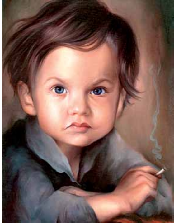
הסדרה "הילדים הגאונים" מציגה דיוקנאות של ילדים כבעלי תפקידים מסורתיים. גוף העבודות מראה ספק ילדים ספק מבוגרים בעלי מבט המתפרש יחיד ואריסטוקרטי, אך גם יתום. הם מעלים בצופה תחושה של "בנים יחידים", כאלה שיעשו הכול על מנת לקבל תשומת לב ושיאהבו אותם. "ככה אני מרגיש בחיים שלי כלפי בעלי שמכות כמו מורים, כלפי נשים שאני רוצה. אני רוצה להרשים מתוך צורך".